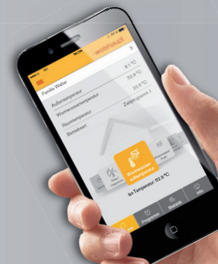
Die Bedienung kann auch per Smartphone erfolgen.